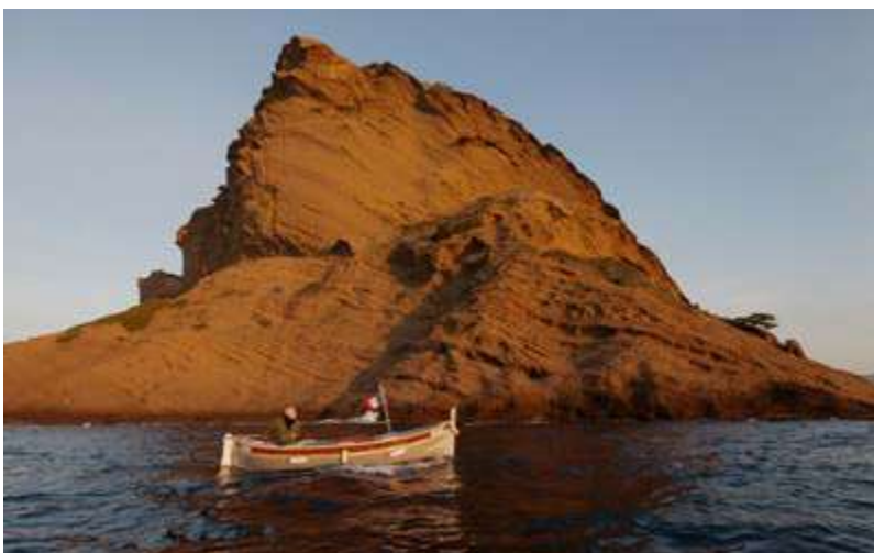
Pêche artisanale au Parc National des Calanques, Marseille (France)

à aborder lors du Congrès mondial de la nature à Marseille. Les cibles d'Aichi, dont celles liées aux AMP, seront examinées en détail. La résolution du Congrès mondial de la nature à Hawaï en 2016 a encouragé les membres de l'UICN à désigner et à mettre en œuvre l'intégration d'au moins 30 % de chaque habitat marin dans un réseau d'aires marines hautement protégées et à prendre d'autres mesures efficaces de conservation. Les preuves scientifiques préconisent la protection complète d'au moins 30 % de l'océan mondial pour inverser les effets négatifs actuels, accroître la résilience au changement climatique et préserver la santé des océans à long terme.