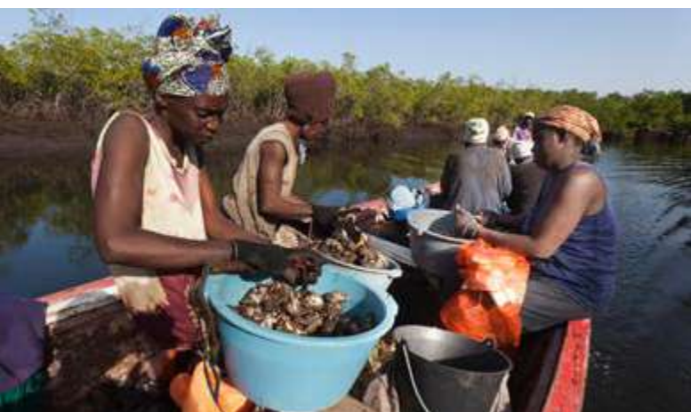
Depuis la création de l'AMP de Bamboung : des femmes locales collectent des huîtres de mangrove sans couper les racines

de mangroves. Ces deux AMP attirent un grand nombre de touristes en raison de leur patrimoine historique, culturel et architectural, de leurs paysages et de leur faune (en particulier les oiseaux aquatiques du Paléarctique). Ces actifs peuvent servir à générer des revenus pour couvrir des coûts de gestion. Quant à l'AMP de Cayar, d'une superficie de 17 100 hectares, elle est située dans une zone à forte productivité. C'est l'un des centres de pêche les plus actifs du pays.