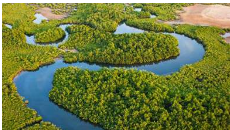
Delta du Sine Saloum vu du ciel, AMP de Bamboung

Compte tenu de l'échec des politiques traditionnelles de gestion de la pêche dans certaines zones, les AMP ont été promues au Sénégal comme des outils efficaces pour la restauration des ressources halieutiques et la conservation de la biodiversité. L'AMP de Bamboung, située au cœur de la Réserve de biosphère du Delta du Saloum, couvre une superficie de 7 000 hectares. C'est un bolong (chenal d'eau salée) avec des points d'entrée très limités. L'AMP de Joal-Fadiouth couvre une superficie de 17 400 hectares et comprend une vaste zone