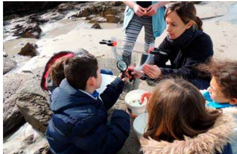
Activité pédagogique au Parc Naturel Marin d'Iroise avec une classe de l'école Jean Monnet du Conquet