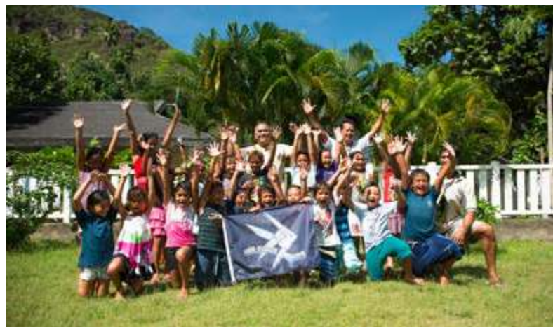
Des enfants de la zone marine à gestion pédagogique de Ua Pou, visitent des écoles de Hakamaï et Haakuti dans les îles Marquises en Polynésie française pour partager leur expérience de gestion de ces zones marines

manière participative par les élèves du primaire, conformément à certains principes. Le concept est né en 2012 aux îles Marquises, en Polynésie française, à la suite de discussions avec des élèves d'une école primaire de Vaitahu. La Polynésie française et les partenaires fondateurs ont depuis lors structuré le concept pour créer un label pédagogique.