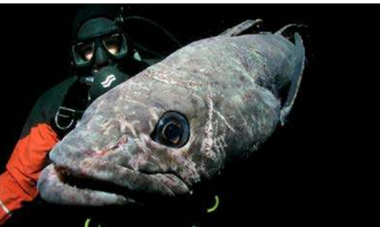
Recherche et surveillance dans l'AMP de la mer de Ross, en Antarctique. Légine antarctique et plongeur

La Commission pour la conservation de la faune et de la flore marines de l'Antarctique : un cas particulier.