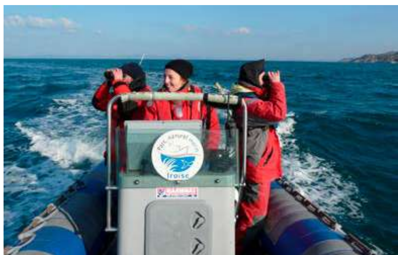
Personnel de terrain en mission de comptage d'oiseaux hivernants dans le Parc Naturel Marin d'Iroise, en baie de Douarnenez

Chaque année, le Parc Naturel Marin d'Iroise publie son tableau de bord montrant les tendances à long terme de sa santé. Le tableau de bord est constitué d'indicateurs, qui sont des moyens simples d'évaluer une réalité complexe, correspondant à chacun des objectifs du plan de gestion du Parc. Son but est de mesurer, année après année, l'état du patrimoine naturel et culturel, la qualité de l'eau, les activités professionnelles et de loisirs et la gouvernance. Le tableau de bord permet aux membres du comité de direction de comprendre la pertinence de leurs actions et d'adapter leurs politiques en conséquence.