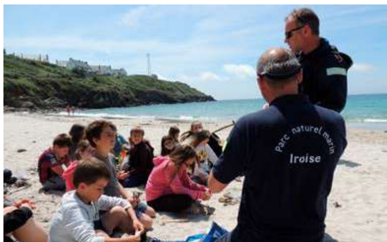
Atelier scolaire sur les "bruits de la mer" dans le cadre du programme pédagogique 2016-2017 du Parc Naturel Marin d'Iroise

L'originalité du tableau de bord du Parc Naturel Marin d'Iroise réside dans son caractère volontairement pédagogique. Globalement, le travail accompli a permis au Parc d'être reconnu comme l'une des AMP les mieux gérées depuis son inscription sur la Liste verte de l'Union internationale pour la conservation de la nature.