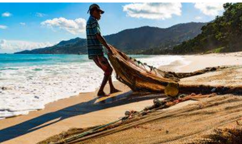
Pêcheur de maquereau pêchant le long de la côte à Beau Vallon, île Mahé, Seychelles

E n 2016, les Seychelles ont conclu avec l'ONG Nature Conservancy un accord sans précédent pour convertir une partie de leur dette souveraine en actions en faveur de la nature. Le gouvernement s'est engagé à protéger 30 % de son territoire maritime (410 000 km 2 ) par la création de nouvelles AMP d'ici 2020. En février 2018, le gouvernement a confirmé la création de deux nouvelles AMP qui couvriront 16 % de la zone économique exclusive de l'archipel.