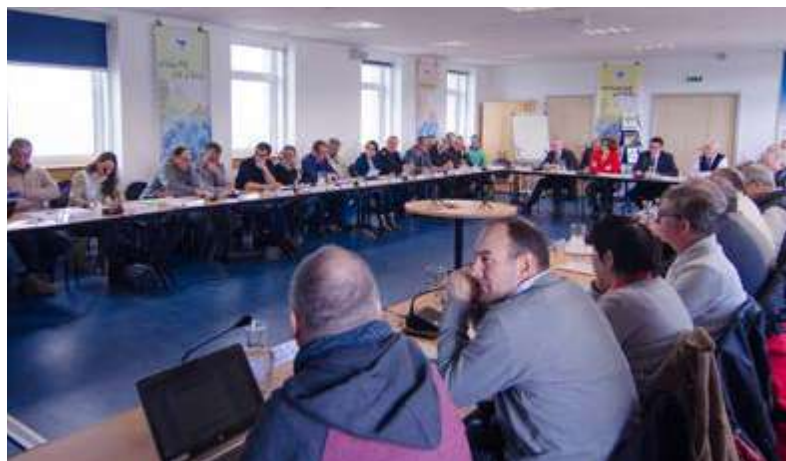
Le Conseil d'Administration du Parc Naturel Marin d'Iroise du 6 février 2018, au Conquet

Plusieurs agents de l'Agence Française pour la Biodiversité sont impliqués dans différents départements pour mettre en place, le cas échéant, des indicateurs communs pour les parcs naturels marins et les rendre compatibles avec les différentes demandes de rapports pour les réglementations européennes telles que Natura 2000 et la Directive Cadre Stratégie pour le Milieu Marin. Aujourd'hui, neuf parcs, dont le Parc naturel marin d'Iroise, forment un réseau de parcs naturels marins. Cela renforce la pertinence d'un système d'évaluation avec une base commune d'indicateurs permettant de mesurer l'efficacité de ces parcs pour mieux prendre en compte le milieu marin.